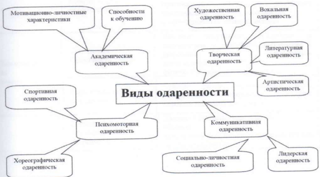
Схема № 1 «Виды одаренности в зависимости от вида предпочитаемой деятельности»

Более подробно виды одаренности в зависимости от вида предпочитаемой деятельности показаны на схеме № 1 и в таблице № 2.